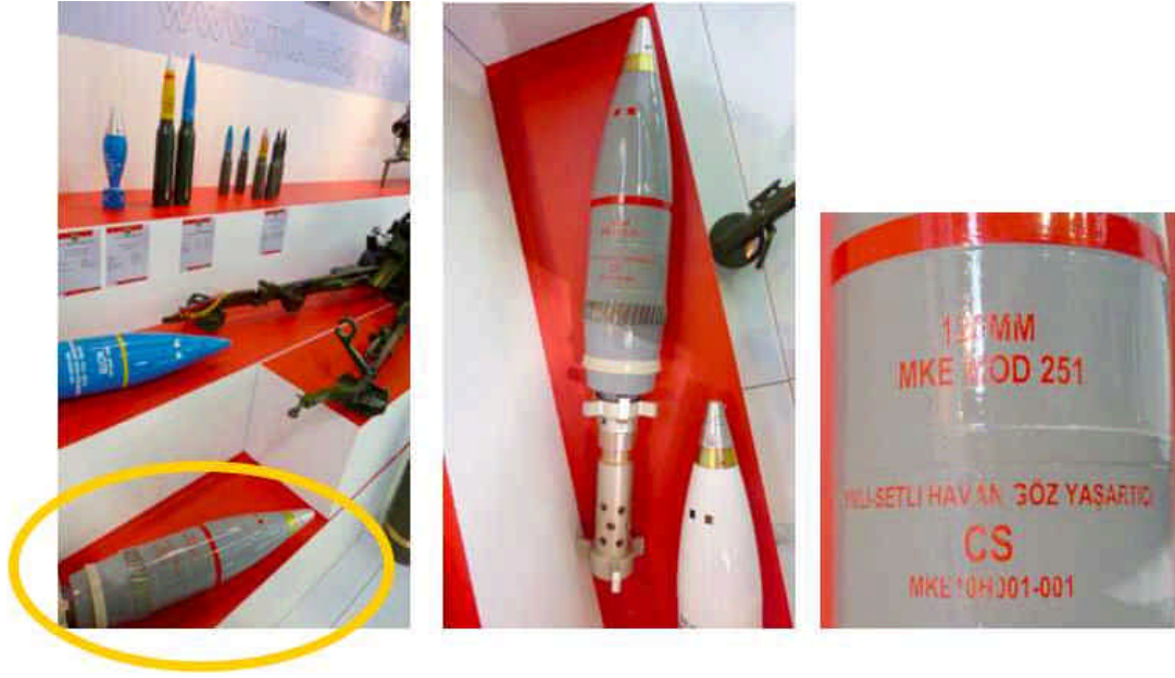
Resim 1: 2010 yılında Kapstadt'taki AAD Silah Fuarında sergilenen Türk yapımı 120 mm kalibrelik CS bombası