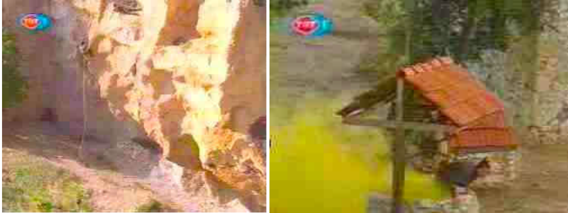
Resim 3: Mayıs 2004 tarihinde TRT 1 kanalında yayınlanan belgeselden alınan kareler. Sağ taraftaki resimde görülen sarı dumanın muhtemelen kimyasal tatbikat dumanı olduğu varsayılmaktadır.

2004 yılında Türk televizyon kanalı TRT 1 de Türkiye'nin anti terör birimi ile ilgili bir belgesel yayınladı. 8 Bu belgeselde askeri tatbikatlarda göz yaşartıcı bomba kullanımının test edilmesi gösterildi. Tatbikat senaryosunda bir mağaraya atılan imha edici bombanın ardından, mağarada hayatta kalanların etkisiz hale getirilmesi için göz yaşartıcı bombanın atıldığı gösterildi (bkz. Resim 3). Başka bir tatbikatta ise bir köyün ele geçirilmesi olayında önce bir ev bomba ile tahrip edildi ve sonrasında, kuyu içine saklanmış kişileri dışarı çıkarmak için göz yaşartıcı bombanın atıldığı gösterildi.